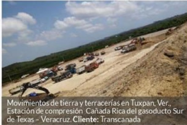
Movimientos de tierra y terracerías en Tuxpan, Ver., Estación de compresión Cañada Rica del gasoducto Sur de Texas - Veracruz. Cliente: Transcanada

Se cuenta con la experiencia en proyectos de pavimentación, terracerías, movimientos de tierra y edificación tanto en la industria privada como nacionales y extranjeras.