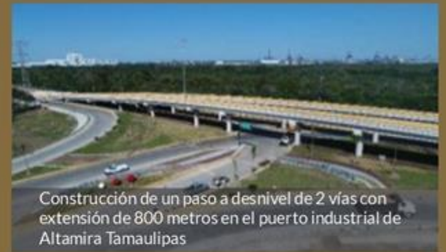
Construcción de un paso a desnivel de 2 vías con extensión de 800 metros en el puerto industrial de Altamira Tamaulipas

Obra merecedora al Premio Lieberman otorgado por la Cámara de la Industria de la Construcción a La Mejor Obra construida en 2018 entre 200 obras presentadas ante el jurado calificador.