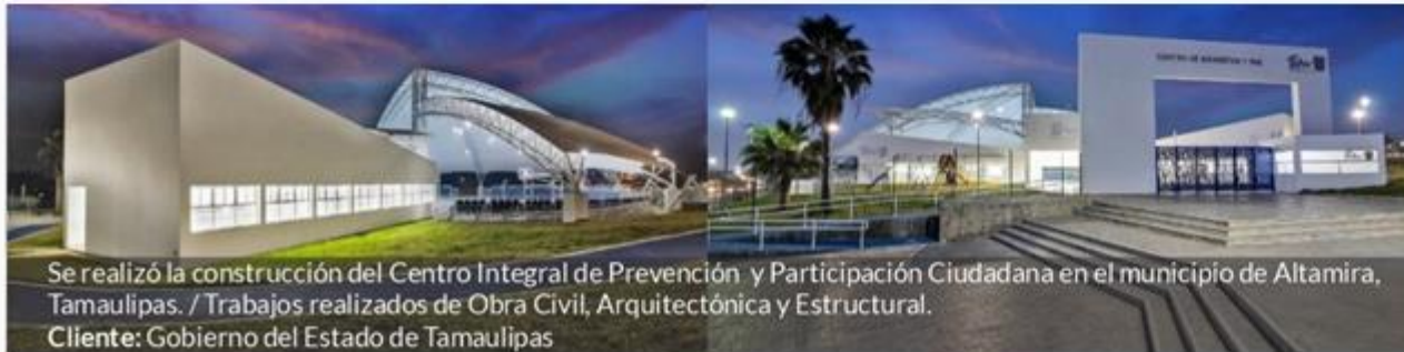
Se realizó la construcción del Centro Integral de Prevención y Participación Ciudadana en el municipio de Altamira, Tamaulipas. / Trabajos realizados de Obra Civil, Arquitectónica y Estructural. Cliente: Gobierno del Estado de Tamaulipas