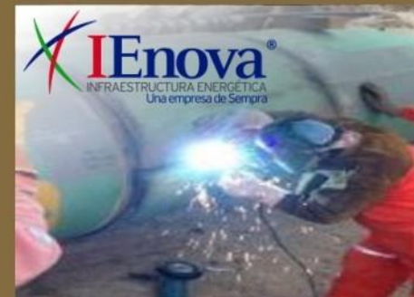
Fabricación e Instalación de envolventes metálicas bipartidas en Gasoducto Los Ramones II

* 4 envolventes instaladas en Gasoducto de 12" Bajío