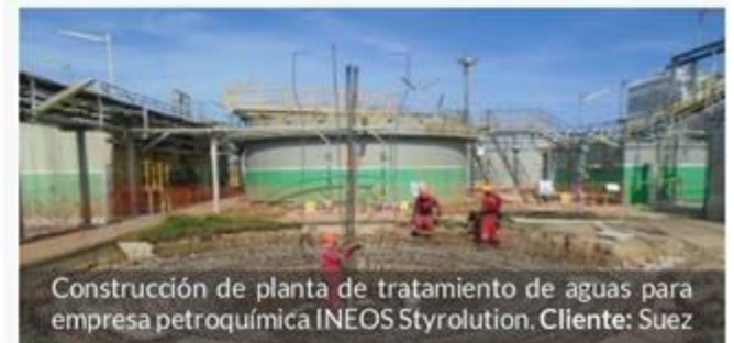
Construcción de planta de tratamiento de aguas para empresa petroquímica INEOS Styrolution. Cliente: Suez