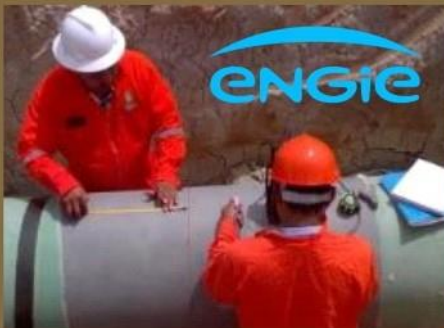
Fabricación e Instalación de envolventes metálicas bipartidas en Gasoducto Mayakan

ENGIE nos ha otorgado un contrato de operación y mantenimiento de sus activos en la zona norte, sur y bajo.